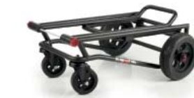
Flacher Transportwagen mit vier Rollen