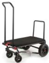
AMG 250 mit optionaler Auflage